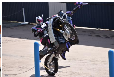
※写真は過去開催のもの